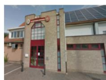
Zaal Concordia Oude Baan 205A, Mariaheide