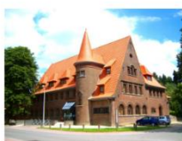
DC De Bolster Kastanjelaan 61, Eisden