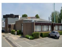
Gemeenschapscentrum Hoekstraat 1, Opgrimbie