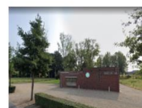
Parochiecentrum Dreef 149, Leut